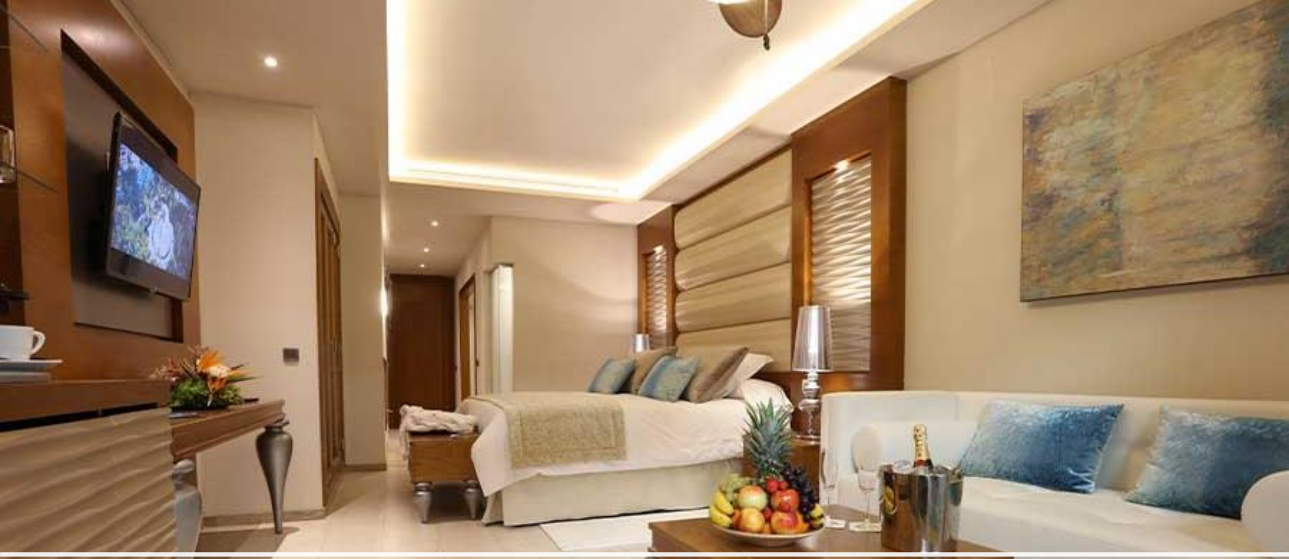
Suite 2 étages avec jacuzzi sur le toit Club Mirage - Vue panoramique Section adultes