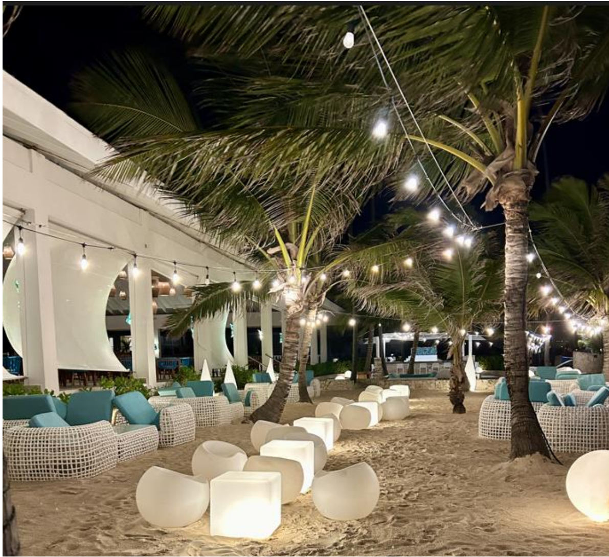
LOUNGE DE PLAGE