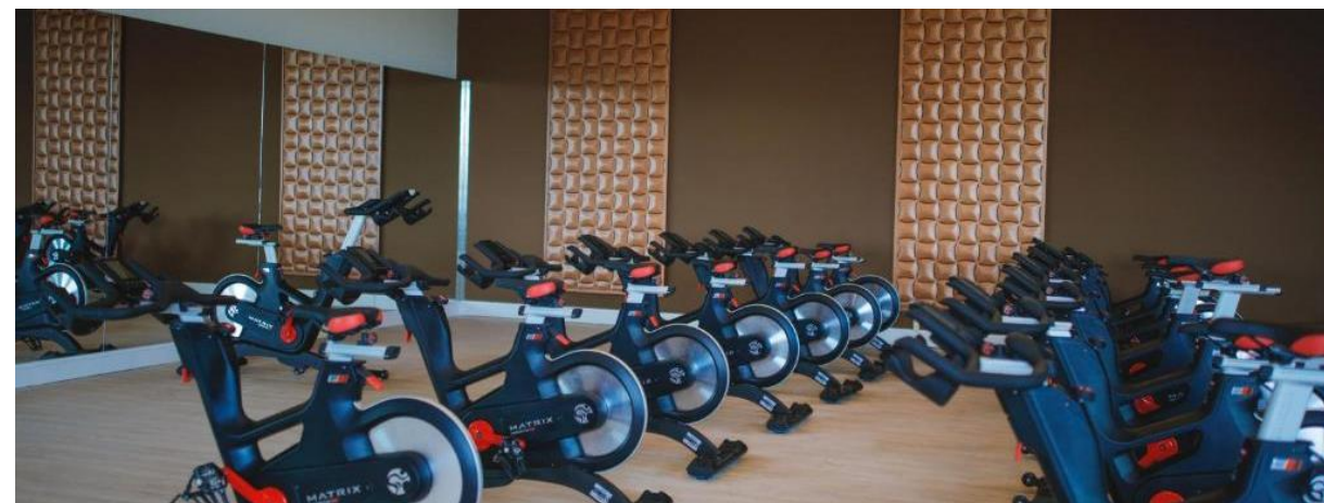
COURS DE SPINNING