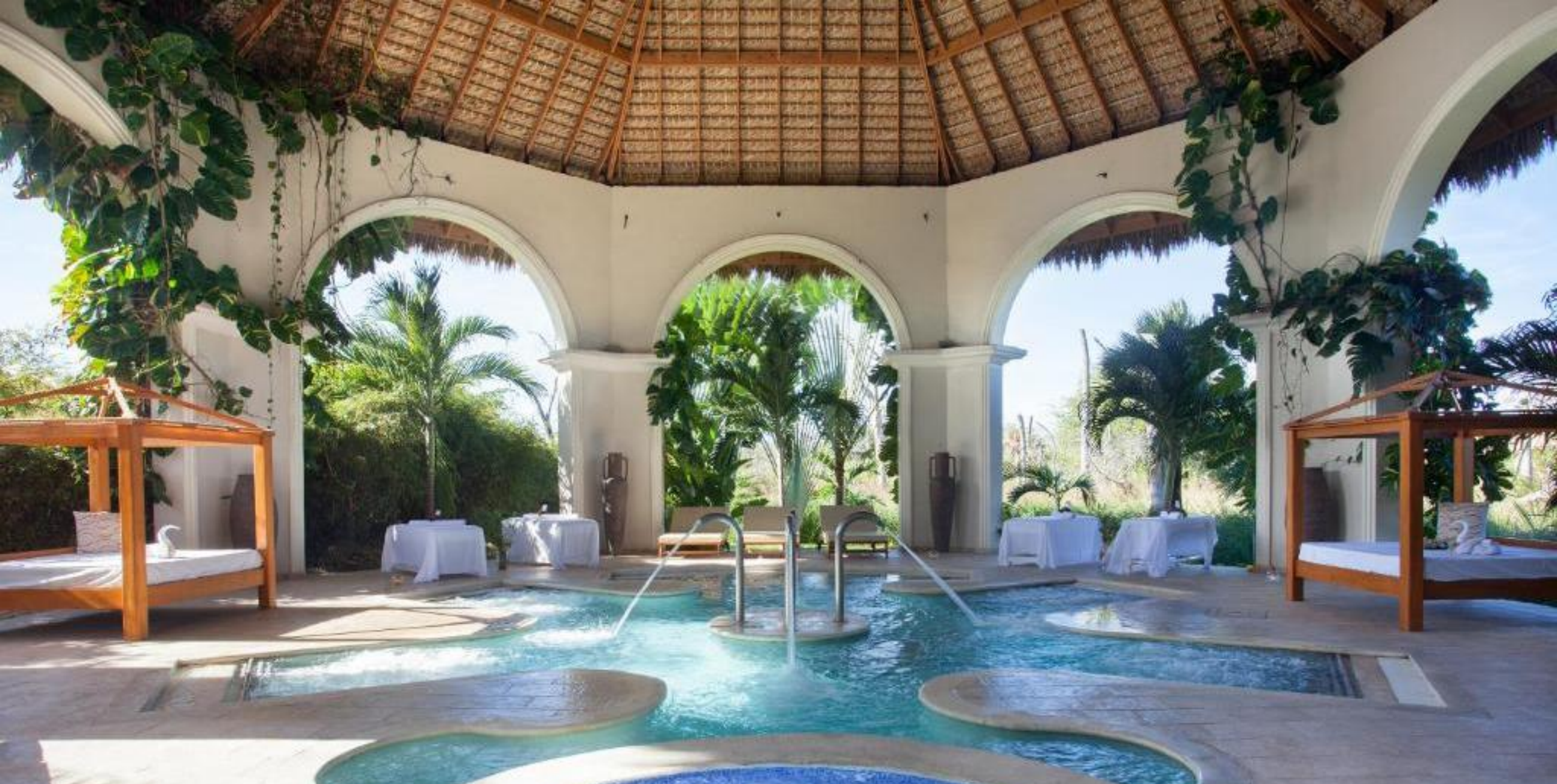
SPA - CIRCUIT D'HYDROTHÉRAPIE