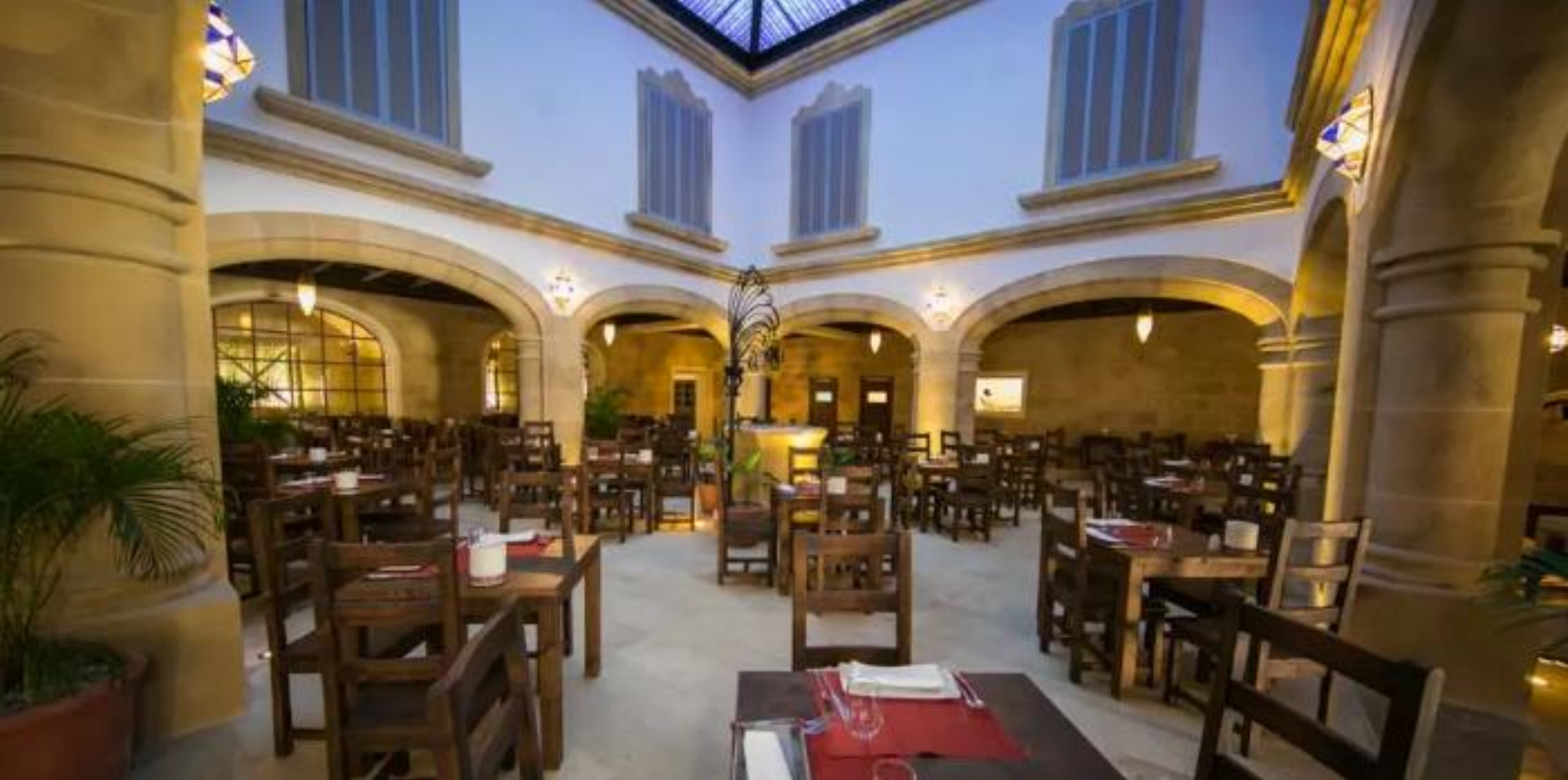
STEAKHOUSE DON JAUME