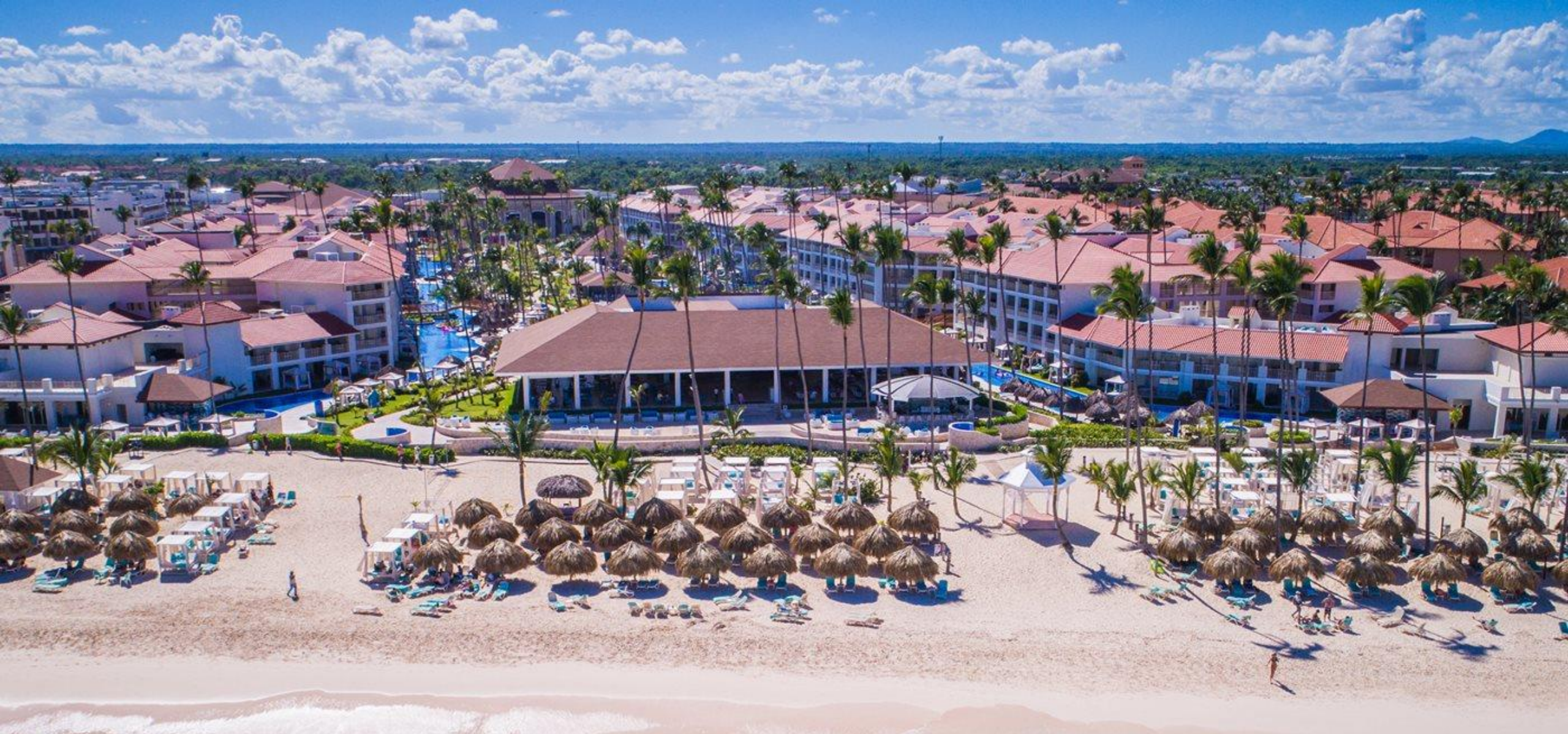
MAGNIFIQUE PLAGES DE BAVARO