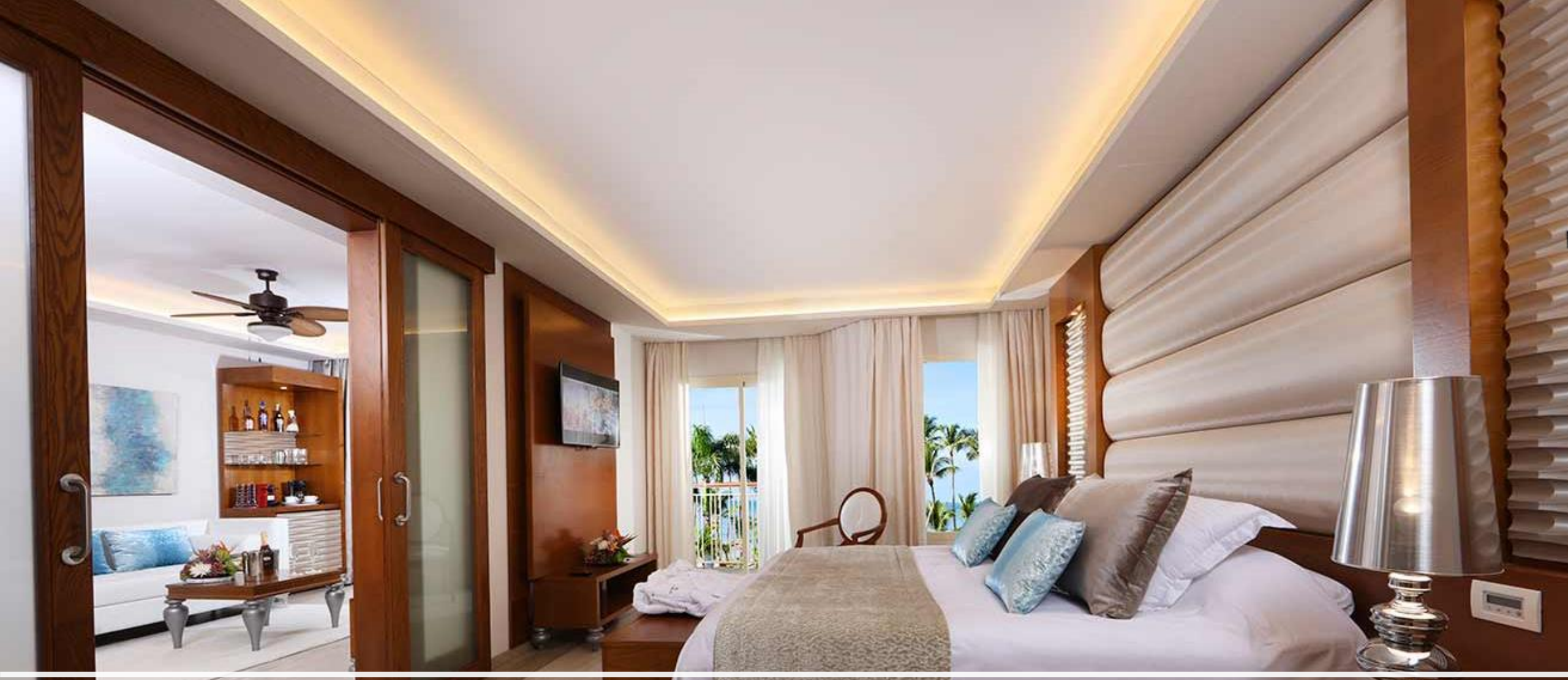
Suite 1 chambre avec jacuzzi extérieur Club Mirage - Section adultes