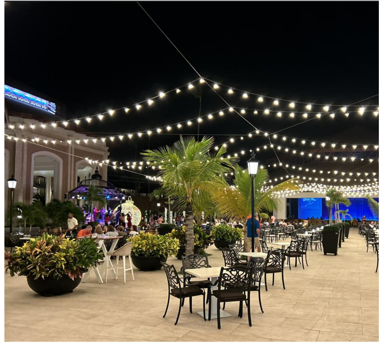
ESPACE COMMUN – RESTOS – BARS - THÉÂTRE - BOUTIQUES