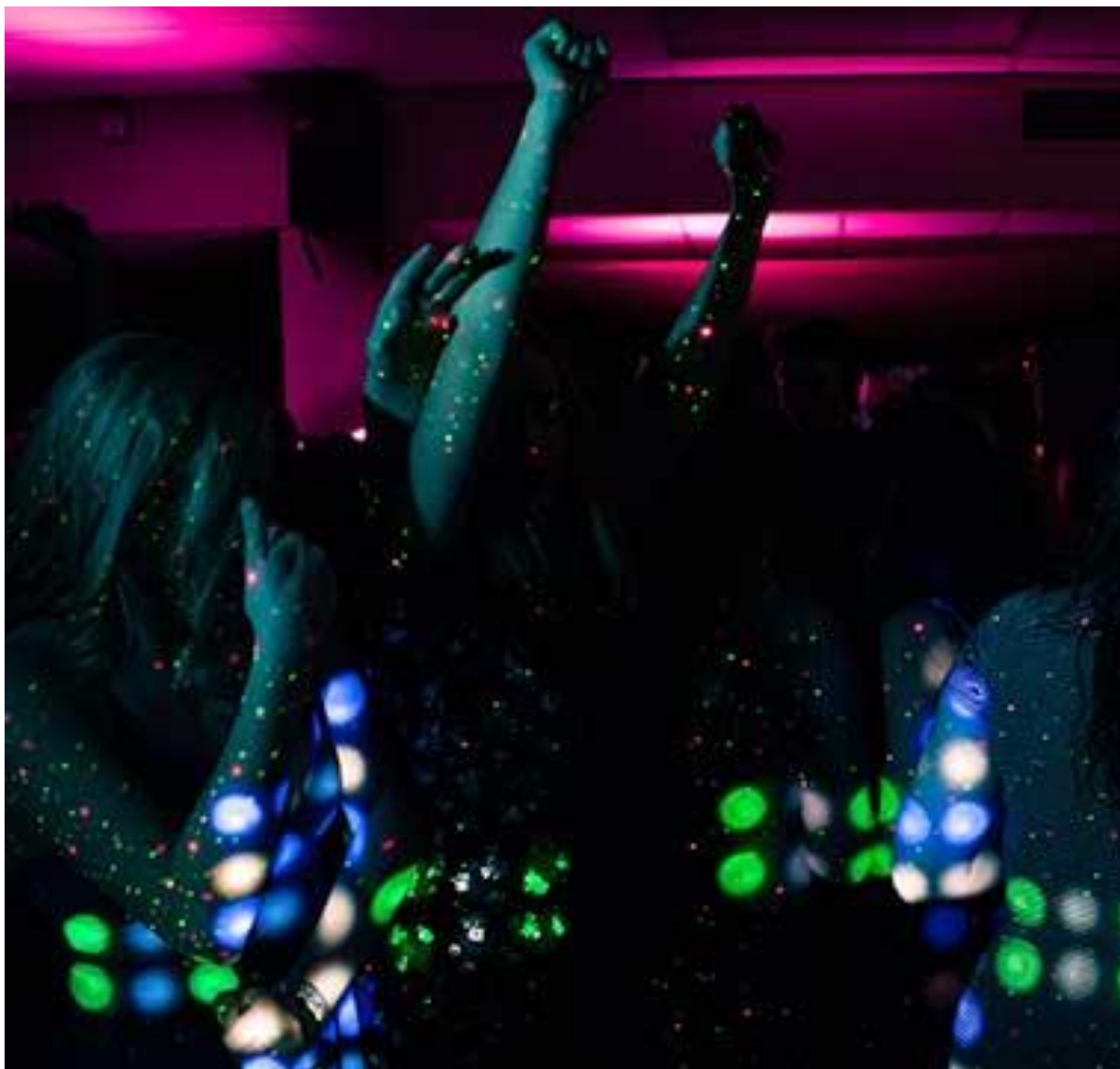
DISCOTHÈQUE COCO'S Au Majestic Elegance – Jusqu'à 02h00