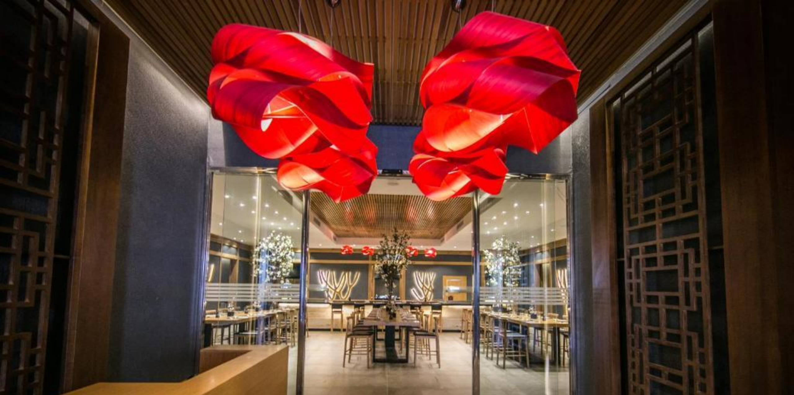
KABUKI – Restaurant Japonais